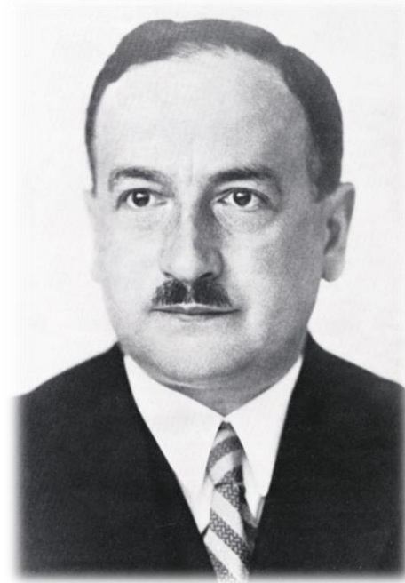
Paspoortfoto van Otto Selz rond 1930, het enige bewaard gebleven portret.

Selz diende aan het westelijk front in Frankrijk, maar toen hij in 1917 gewond raakte werd hij naar Berlijn gehaald. Het Ministerie van Oorlog liet hem onderzoeken hoe je vliegtuigongelukken kon voorkomen. Hij ontwikkelde gedetailleerde ongevalsprotocollen, en ontdekte daarmee hij dat vliegtuigpersoneel eenvoudigweg niet beschikte over enig doelgericht denkschema voor noodsituaties. Het personeel zou daarom moeten oefenen met allerlei noodsituaties, zodat ze in voorkomende gevallen snel konden putten uit een rijk repertoire van denkschema’s: effectieve, doelgerichte handelingen. Na de oorlog werd Selz gedecoreerd met het IJzeren Kruis, en benoemd tot hoogleraar psychologie en pedagogiek.