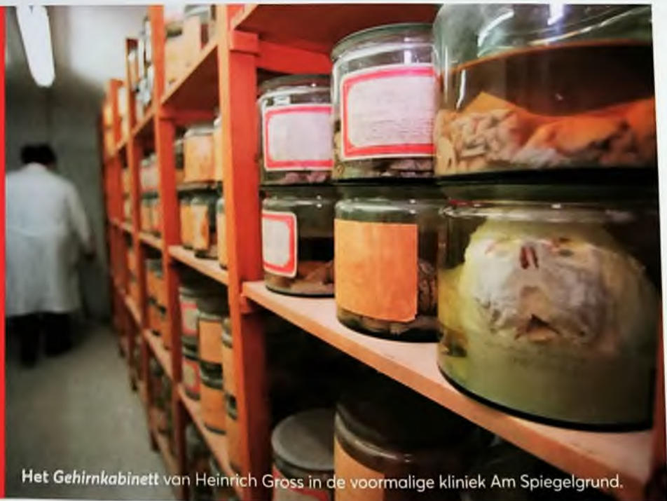
Het Gehirnkabinett van Heinrich Gross in de voormalige kliniek Am Spiegelgrund.

Die zou haar – en talloze andere kinderen in het Weense Paviljoen des Doods – fataal worden. Irma overleed op 8 januari 1944. Het overlijdensbericht ontving de familie een jaar later, met het verzoek alsnog de kosten van haar verzorging te voldoen. Irma's hersenen waren, evenals die van 788 andere kinderen, jarenlang bewaard in een glazen pot in een houten stellingkast: het Gehirnkabinett van de Weense nazi-arts Heinrich Gross. De overblijfselen van de overige kinderen werden in 2002 bijgezet op de Zentralfriedhof in Wenen, met naam en toenaam (voor zover bekend), in de sectie die is gereserveerd voor slachtoffers van het naziregime.