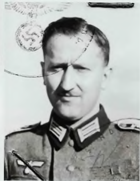
Heinrich Gross, hier in het uniform van de Wehrmacht, was trots op zijn verzameling kinderhersenen.

Anatomen waren in nazi-Duitsland sowieso verwend met het aanbod. In 1940 lanceerde Berlijn het beruchte euthanasieprogramma. Hitlers lijfarts Karl Brandt zou later aan het Neurenbergse oorlogstribunaal uitleggen dat daarmee louter 'consequent doorgevoerde menselijkheid'